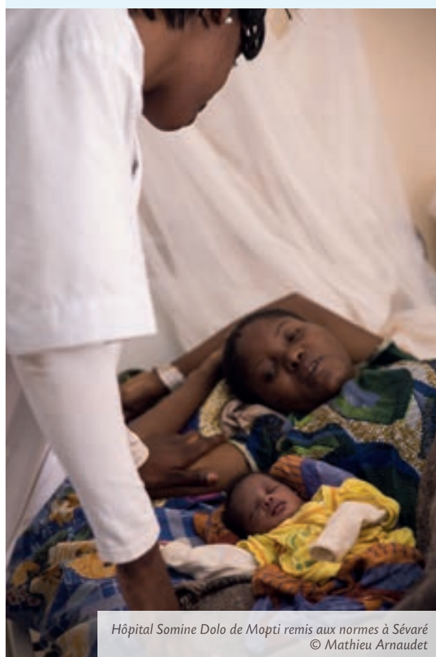
Hôpital Somine Dolo de Mopti remis aux normes à Sévaré

Les ONG peuvent bénéficier des concours de l'AFD soit pour financer leurs propres initiatives, soit dans le cadre d'un dispositif spécifique d'appel à propositions innovantes (FISONG). À ce titre, les ONG présentes au Mali interviennent notamment dans les secteurs de l'agriculture, de la santé, de la promotion des droits humains et de la société civile, de l'environnement et de l'éducation. Elles peuvent également être financées par le Fonds Français pour l'Environnement Mondial (FFEM).