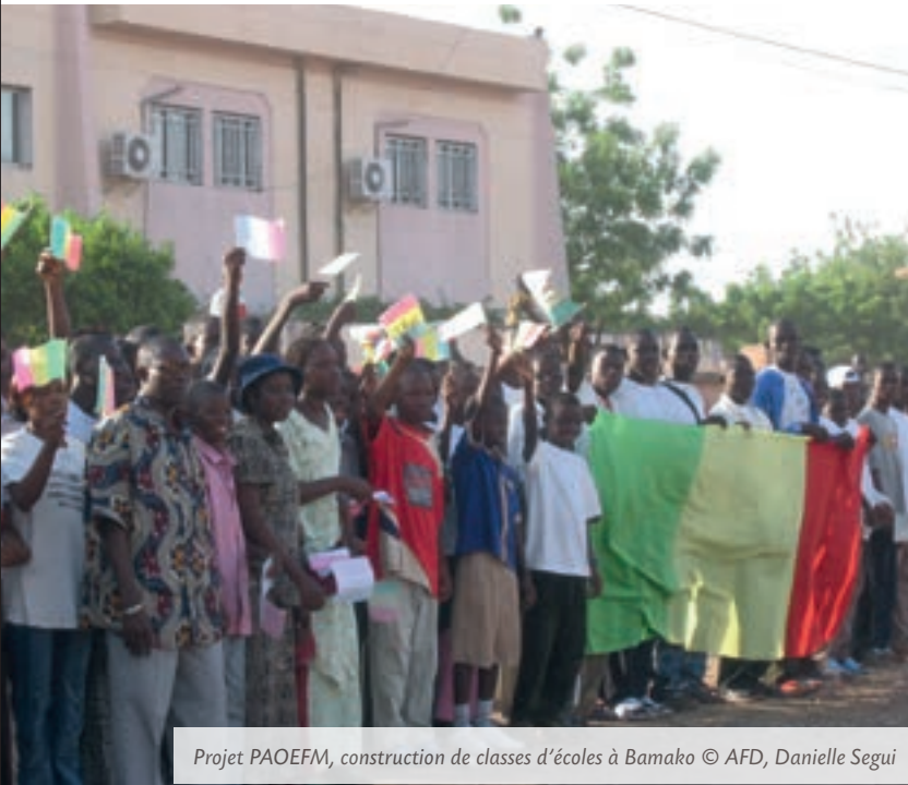
Projet PAOEFM, construction de classes d'écoles à Bamako