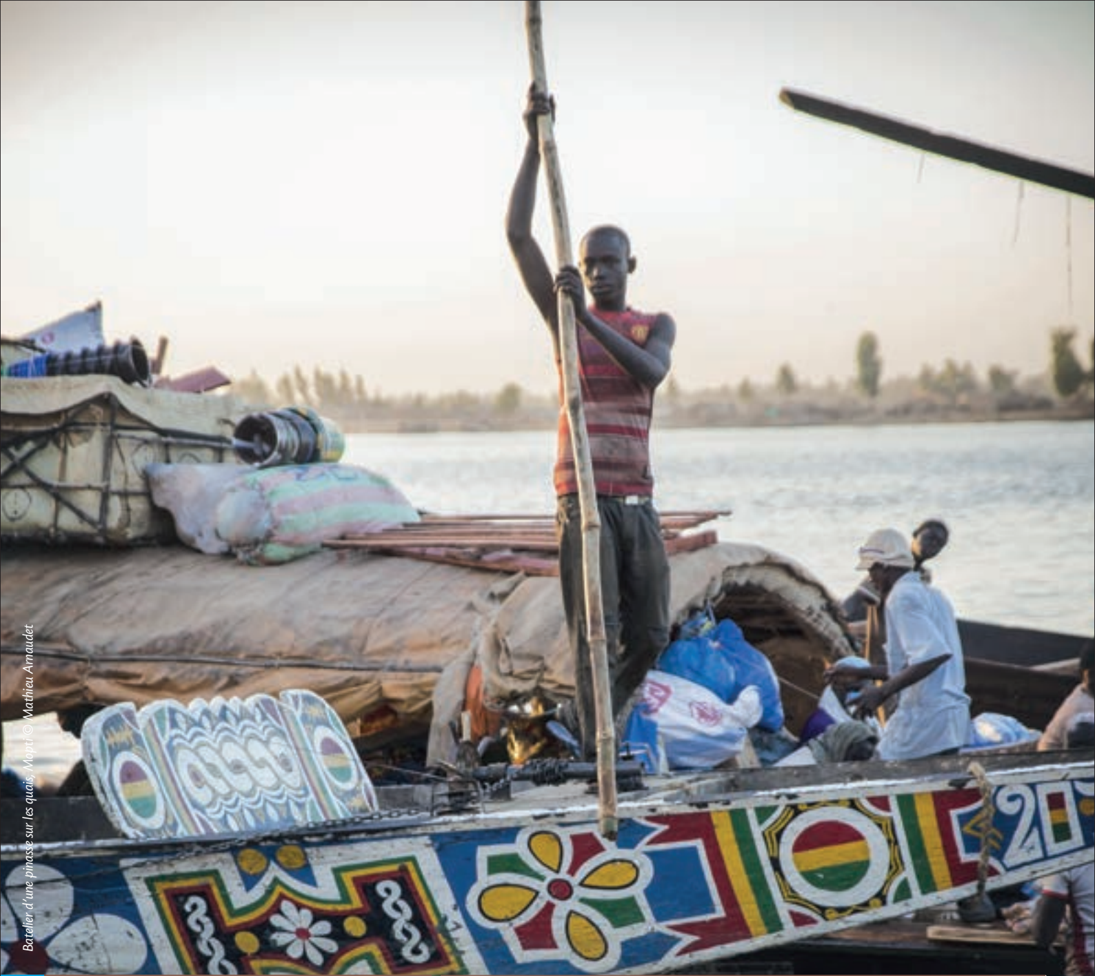
Bateaux d'une pinasse sur les quais - Mopti